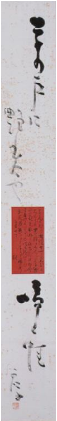
正岡子規 左千夫宛書簡 高濱虚子 句