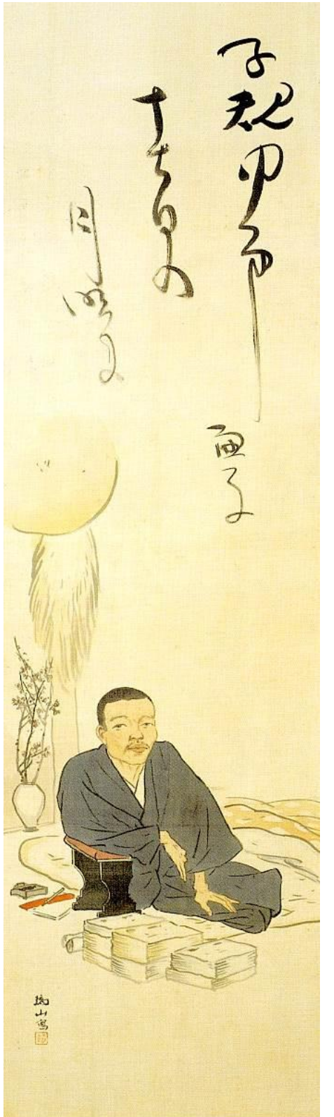
高濱虚子 句 下村為山 子規居士像

平成二十八年二月十三日より四月三日まで、本館二階企画展示室において、企画展「上條信山×池上百竹亭×田村一男 トリプルアタック!」コレクションとの新たな出会いが開催されます。広い空間で、改めて池上百竹亭コレクションの滋味深さを感じていただく機会となれば幸いです。