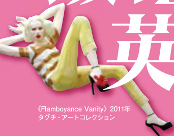
《Flamboyance Vanity》2011年 タゲチ・アートコレクション