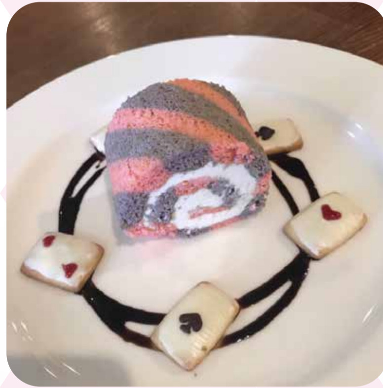
♠ チェシャのしっぽ (¥830)