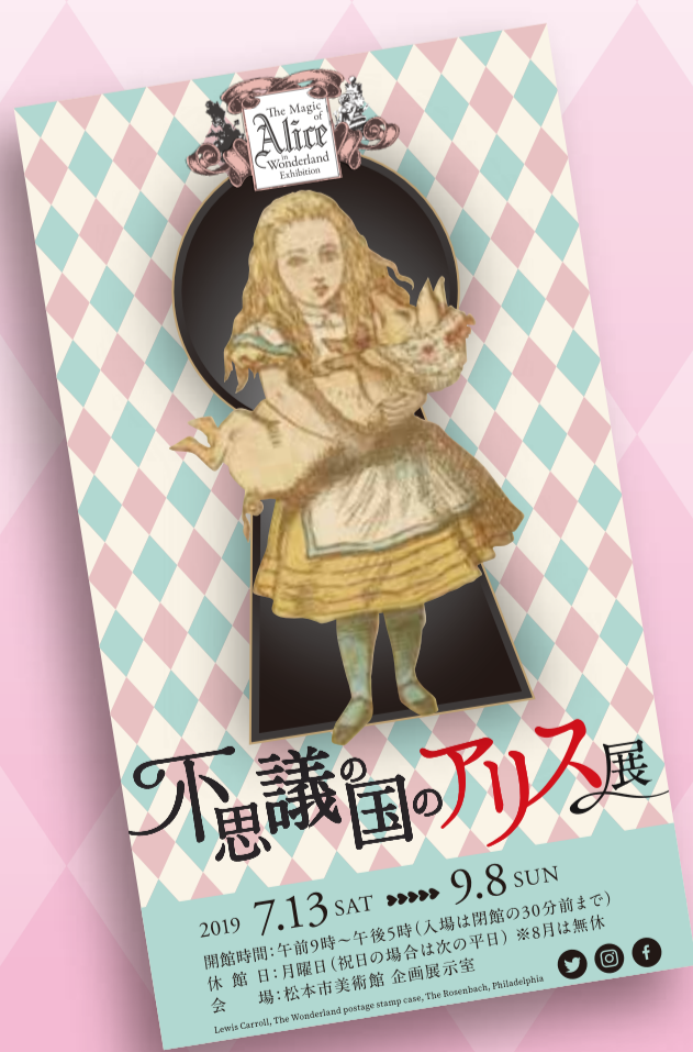
不思議の国のアリス展 チケット半券見本