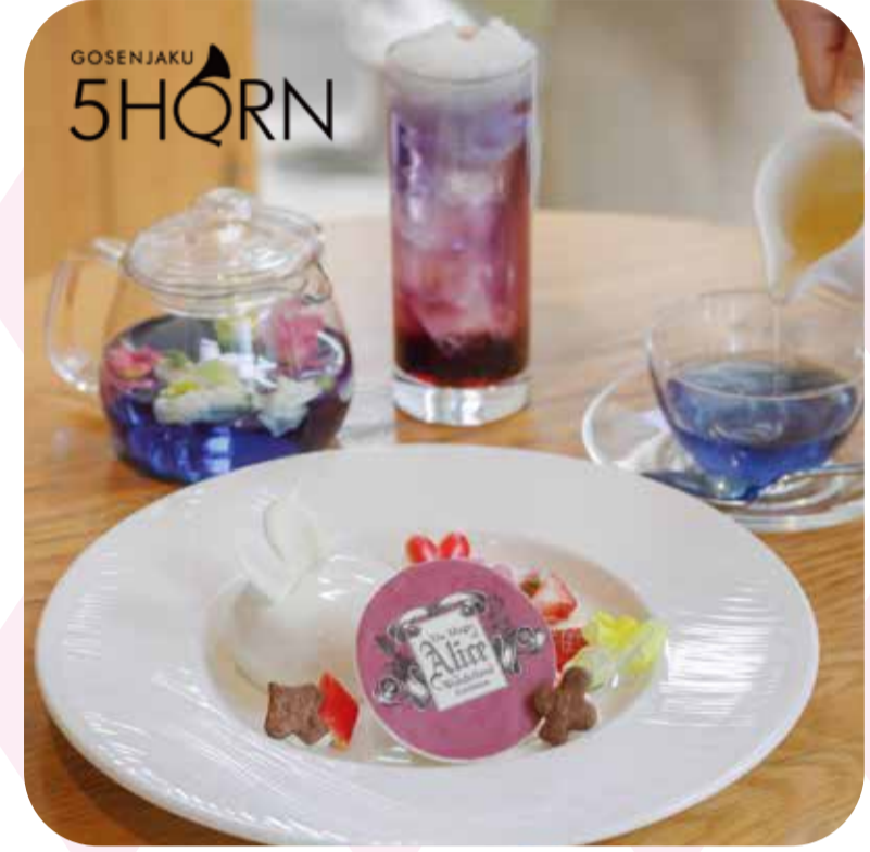
♠ ホワイトチョコとアールグレイのムース 白うさぎ仕立て (¥860)