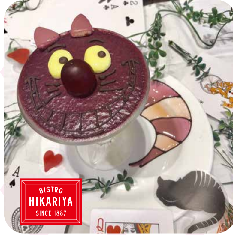
♠ チェシャ猫パフェ (1日5個限定、¥1,296)