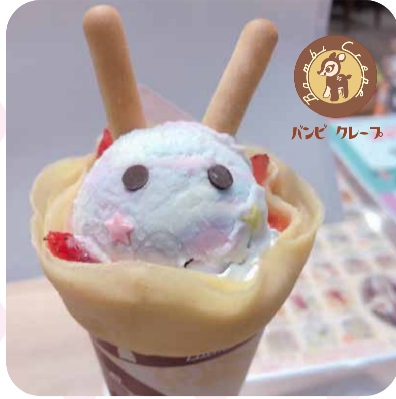
♠ アリスのクレープ (¥594)