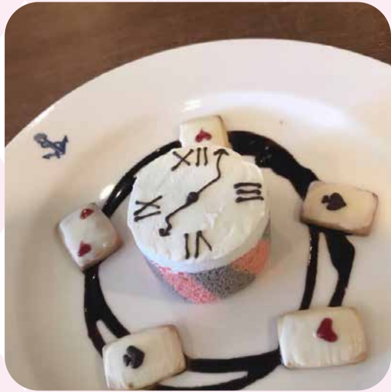
♠ 時間の国のアリス (¥830)