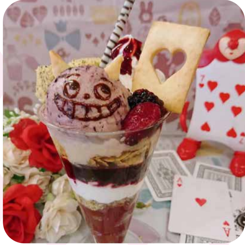
♠ 不思議の国のアイスパフェ (¥700)