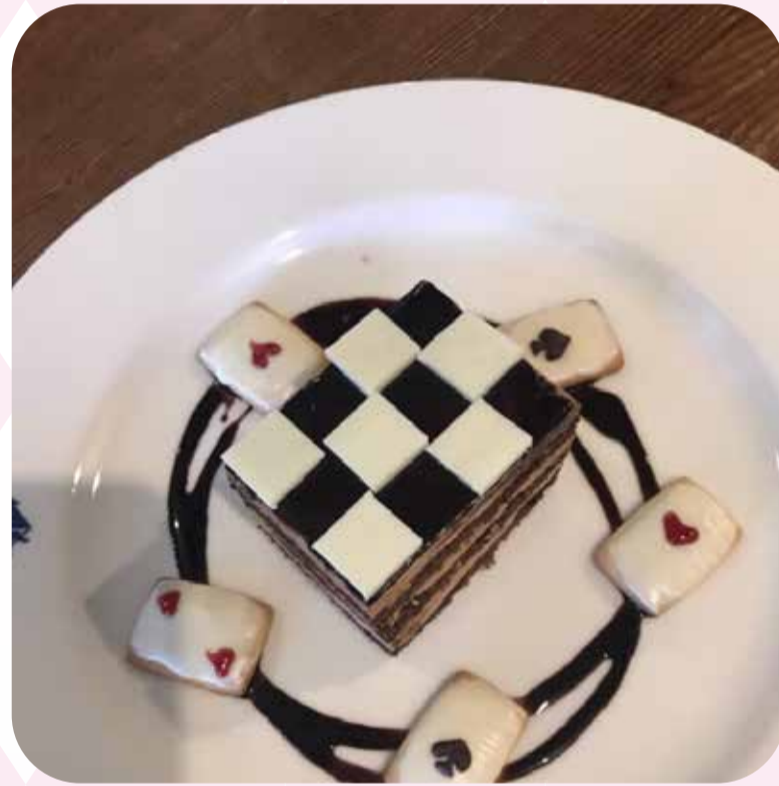
♠ チョコレート チェス (¥830)