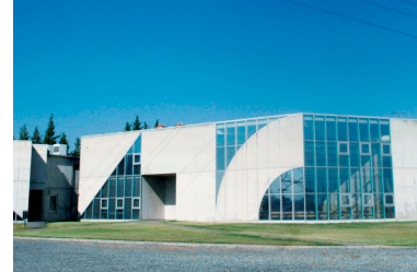
日本浮世繪博物館