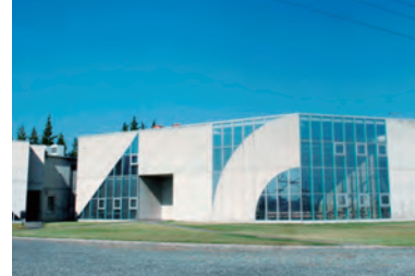
日本浮世絵博物館