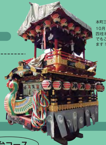
本町三丁目の舞台 10月1日~3日の 四柱神社・神道祭 でもご覧いただけます!