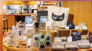
▲ミュージアムショップでは、「Y-cat」のオリジナルグッズや山崎監督直筆のデザイン画ポストカード、「ゴジラ-1.0」の公式グッズなど取扱中

YAMAZAKI Takashi, Profile 1964年、松本市生まれ。株式会社白組所属。2000年「ジュブナイル」で監督デビュー。CGによる高度なビジュアルを駆使した映像表現・VFXの第一人者。『ALWAYS 三丁目の夕日』(2005年)では、心温まる人情や活気、空気感を持つ昭和の街並みをVFXで表現し話題になり、第29回日本アカデミー賞最優秀作品賞・監督賞など12部門を受賞。『永遠の0』(2013年)では、第38回日本アカデミー賞最優秀作品賞など8部門を、共同監督を務めた『STAND BY ME ドラえもん』(2014年)では、最優秀アニメーション作品賞を受賞。日本を代表する映画監督の一人。