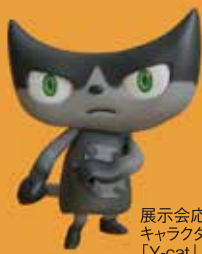
展示会応援 キャラクター 「Y-cat」

松本市出身の映画監督・山崎貴は、VFX(ビジュアル・エフェクツ/視覚効果)を駆使し、『ALWAYS 三丁目の夕日』シリーズや『SPACE BATTLESHIP ヤマト』『永遠の0』『DESTINY 鎌倉ものがたり』など、CG合成とは思えない緻密な映像をつくりあげることで知られています。またその作品の多くで脚本を手がけ、原作ファンも裏切らない演出力で、日本人の心に響くエンターテインメント性の高い映画をつくってきました。