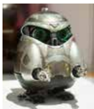
▲映画「ジュブナイル」より「テトラ」