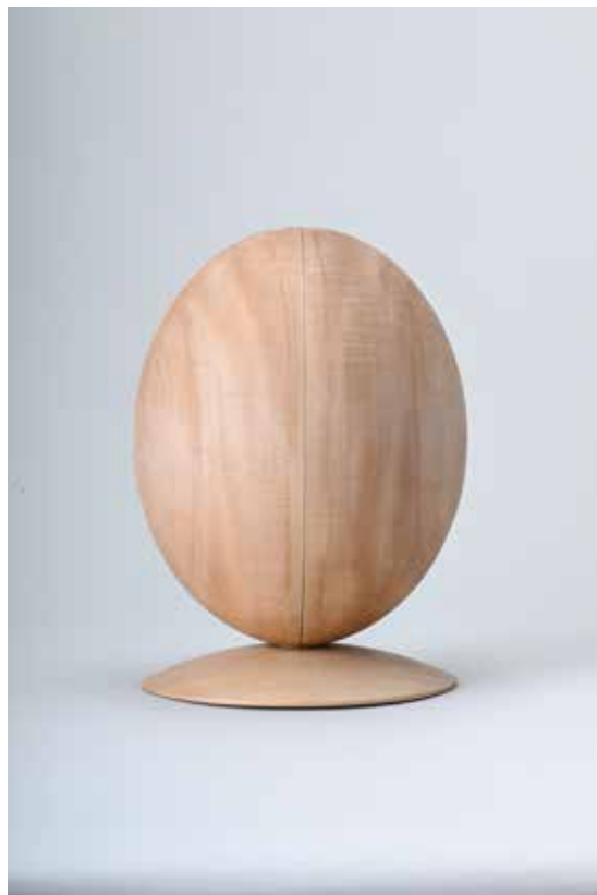
栃檜門厨子・高さ36cm・谷進一郎

To celebrate the 20th Anniversary of the Exhibition of Master Woodworkers in Shinshu, this special exhibition will be held at the Matsumoto City Museum of Art. Works by woodworkers who have participated over the years will be presented, offering visitors an opportunity to experience the many facets of Shinshu's woodworking traditions.